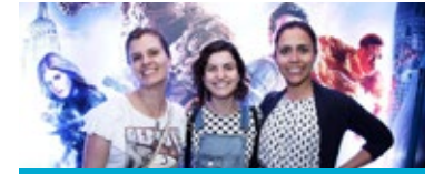
O Quarteto Fantástico | 04/08