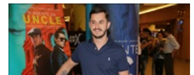
O Agente Uncle | 31/08