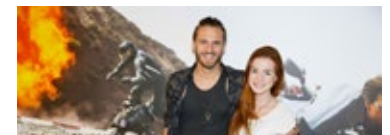
Missão Impossível – Nação Secreta | 10/08