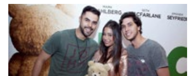
Ted 2 | 25/08