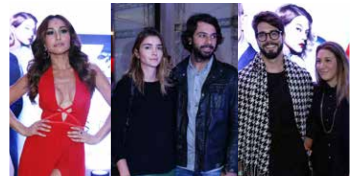
007 Contra Spectre | 04/11