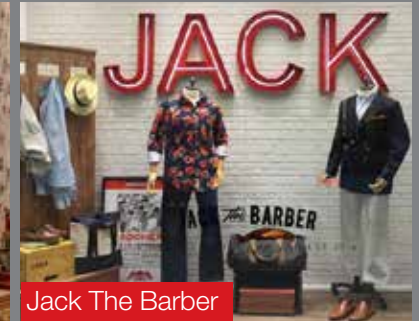
Jack The Barber