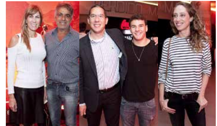
Perdido em Marte | 29/09

A movimentação em nossas salas de cinema é sempre muito contagiante em dias de pré-estrela. Entre os últimos filmes que invadiram as telas do Cinépolis, a avant-première de dois deles merece destaque. Descubra nas fotos o por quê.